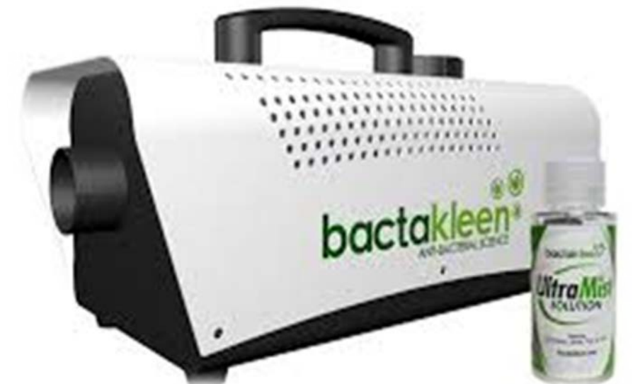
BACTKLEEN BT ウルトラミスト噴霧器

TUV: 「TUV Rheinland」ドイツ・ケルンを拠点とする安全性・技術に関する検査機関